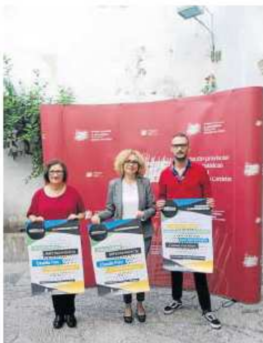
La presentación del festival, ayer.

que "un elemento que distingue a DMencia de otros proyectos de arte contemporáneo es la adquisición de una obra a cada uno de los artistas que han expuesto en el pueblo, lo que ha contribuido a crear un fondo artístico de casi cien obras".